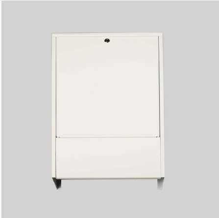
Verteilerschrank Aufputz, weiß (RAL 9010)