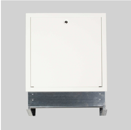
Verteilerschrank Unterputz, weiß (RAL 9010)